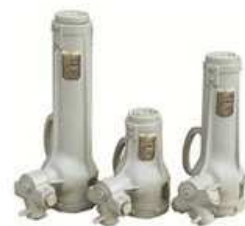
高揚程 低揚程 中揚程